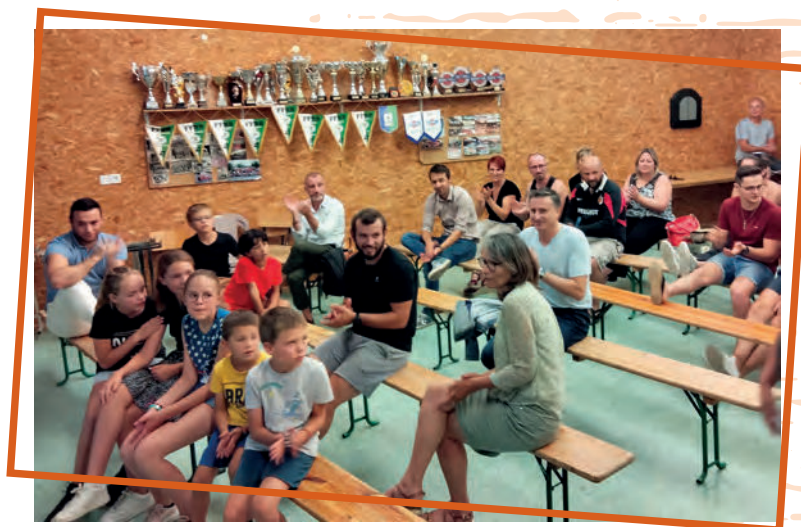
Assemblée Générale du Basket

L'Association Vivre Mieux Ensemble a fait sa restitution du nouveau contrat de projet 2022-2026. Un contrat de projet examiné par la CAF qui donne l'agrément Centre social.