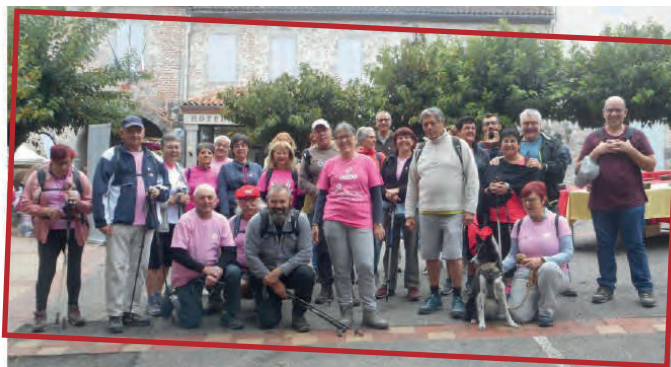
Randonneurs au départ de la rando Octobre Rose

Nous pouvons vous accueillir lors d'une de nos randonnées, en tant qu'invité, afin que vous puissiez vous rendre compte de notre activité.