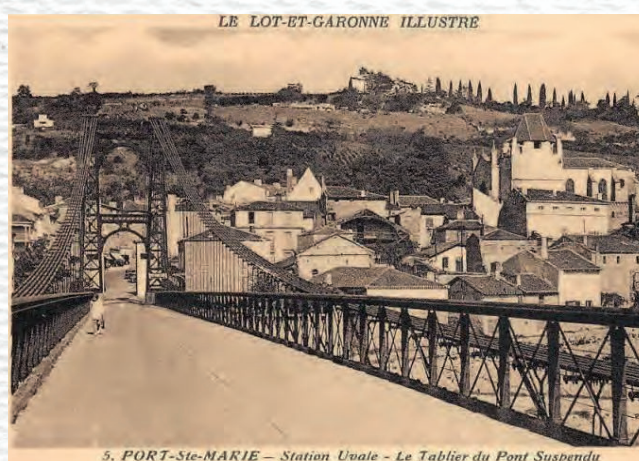
5. PORT-Ste-MARIE - Station Voie - Le Tablier du Pont Suspendu