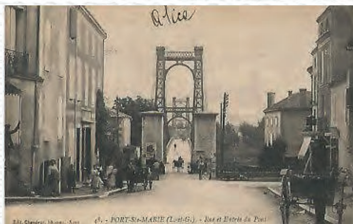
48. - PORT-Ste-MARIE (Lot-et-G.) - Rue et Entrée du Pont